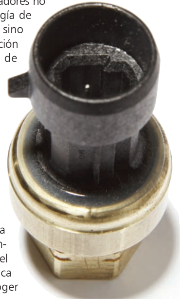
Figura 4. Conector con terminal atornillado de forma hexagonal (1/8" macho, 1/4" hembra)

"Gracias a la extensa red de EBV Elektronik tenemos acceso a una base de clientes completamente nueva en el ámbito de la electrónica industrial", explica Roger Appelo, Director de Desarrollo del Negocio para productos sensores de Sensata en Europa. "Por otra parte, EBV Elektronik tendrá acceso a una tecnología de sensor de alta calidad y completamente madura que aún conserva todo su potencial. Desde nuestro punto de vista se trata claramente de una situación con todas las de ganar. Con la producción de los correspondientes sensores para automoción en cantidades de varios millones de unidades al año EBV está en condiciones de ofrecer los sensores de presión a un precio muy atractivo". Estos EBVchips fueron desarrollados en Holanda y en EE.UU. El sensor completo, incluyendo la producción de la parte cerámica, se fabricará en México, donde Sensata también produce sus sensores para automoción. 📍