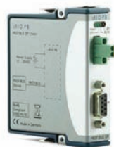
PROFIBUS Interface Modules for NI CompactRIO