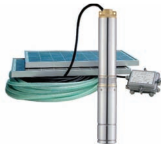
Bomba solar para pozos hasta 80 m

No podíamos olvidar las muy conocidas bombas sumergibles solares, con más modelos y 2 super-bombas que permiten alcanzar hasta los 80 metros de profundidad. No habrá pozo o depósito que se nos resista.