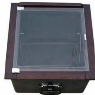
Horno solar portátil

Por último la familia de los medidores medioambientales, como el electro-sensor, medidor de los campos electromagnéticos, o medidores de la calidad del aire (CO2), solarímetros y medidores del nivel de ozono, equipos ajenos a nosotros hace unos años, pero que poco a poco se van a ir normalizando, y serán indispensables para todos aquellos que estemos mínimamente preocupados por nuestro medio ambiente y nuestro planeta.