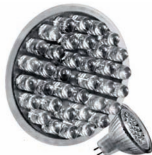
Bombillas a led en diferentes formatos

En la era del LED no podíamos dejar de crecer, y se ha introducido una gama de bombillas a led muy amplia y económica, con los formatos más habituales MR11, MR16, GU10, E14, y E-27, en las 2 tensiones 12 V CC, CA, y 230 V CA.