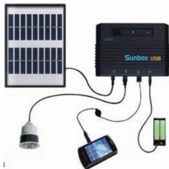
Pack solar SunBox

Igualmente, hemos pensado que los pequeños Packs Solares, solo enchufas y ya funciona (Plug&Play), pueden facilitar a muchos ciudadanos el uso de estos packs y hacerlos más populares.