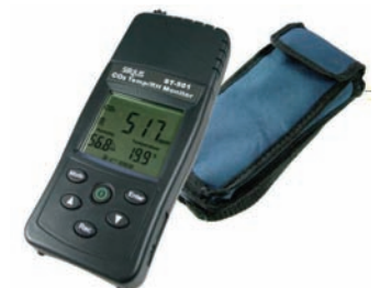
Medidor digital profesional de la calidad del aire en interiores (CO2 / Temp / HR)