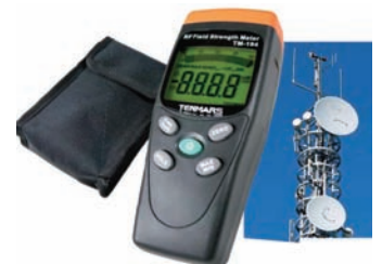
Detector de fugas de Microondas