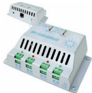
Reguladores solares MPPT (seguidores del punto de máxima potencia)

En este nuevo proyecto, hemos incorporado por un lado más productos, como baterías solares más potentes, una gama de convertidores y de reguladores más profesional y mucho más amplia.