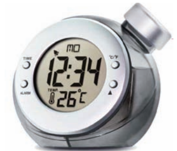
Maxi despertador – termómetro digital LCD.

Por último la familia de los medidores medioambientales, como el electro-sensor, medidor de los campos electromagnéticos, o medidores de la calidad del aire (CO2), solarímetros y medidores del nivel de ozono, equipos ajenos a nosotros hace unos años, pero que poco a poco se van a ir normalizando, y serán indispensables para todos aquellos que estemos mínimamente preocupados por nuestro medio ambiente y nuestro planeta.