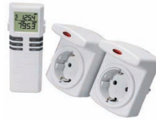
Set inalámbrico para el control del gasto eléctrico

En Ecología Doméstica presentamos enchufes inteligentes para el ahorro energético, cocinas y hornos solares, packs de ahorro, medidores de consumo eléctrico, que son una apuesta clara por la concienciación popular con el ahorro de energía, y por un concepto de vida más sostenible.