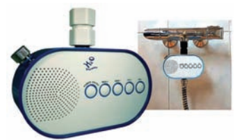
Radio para la ducha. Funciona con la presión del agua