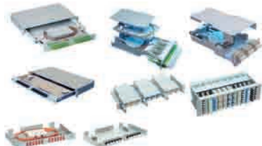
Sistemas de F.O.