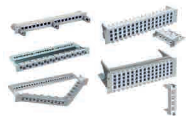
Paneles de conexión de 1, 2 y 3 unidades