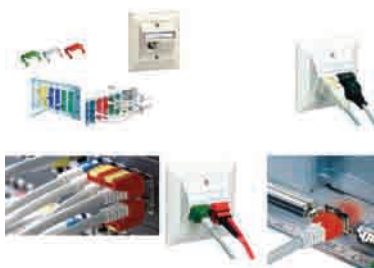
Sistemas de Seguridad