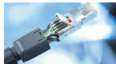
FM45 – Directo al cable de instalación. Se acabó el exceso de cable.