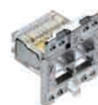
RMS 45 – Información y entretenimiento para todos: con el RMS es posible compartir cables de forma inteligente y reducir los costes de instalación y tendido

Las soluciones de cableado de R&M le dan la bienvenida a la era de los sistemas de información clínica totalmente integrados. Le ayudarán a mejorar el bienestar de sus pacientes y del personal sanitario. Un futuro