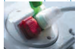
un nodo con protección IP54/65/67a partir de un conductor estándar. También es resistente a los productos de limpieza.