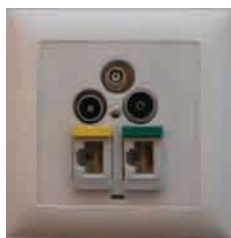
Sistema Multimedia en las habitaciones

Disponibilidad de una solución multiservicio (TV, voz, datos, radio, Recep. satélite...) Alto rendimiento (Clase E, Clase EA).