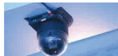
Patch Guard – Conexiones RJ45 con protección contra desconexión también en, zonas de libre acceso. Especialmente adecuadas para la conexión de cámaras. Sistemas de vigilancia