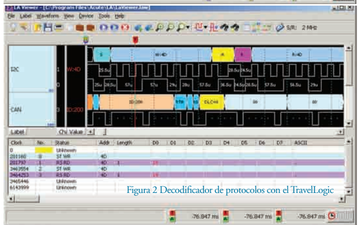
Figura 2 Decodificador de protocolos con el TravelLogic