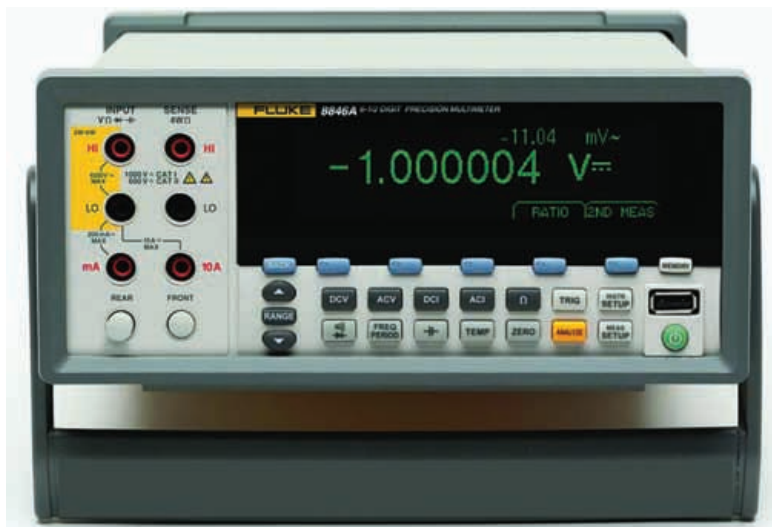
Tabla 1. El 884X puede realizar estadísticas de estas mediciones.

Al igual que la función STATS, la función HISTOGRAM comienza en cuanto se pulsa la tecla de función HISTOGRAM. El cálculo se puede iniciar y restablecer con la tecla RESTART.