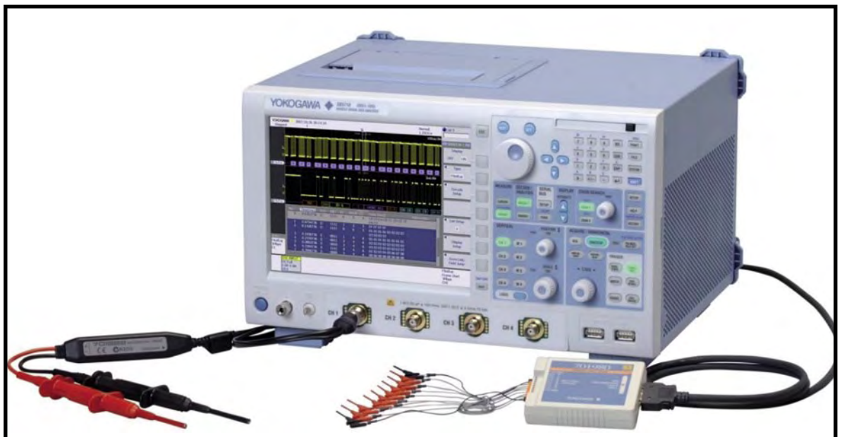
Figura1. El SB5000 de Yokogawa es un analizador de buses serie basado en osciloscopio, enfocado a protocolos de bus serie para automoción (FlexRay, CAN y LIN), que también incorpora triggers y análisis para otros estándares (UART, I2C y SPI).

Los MSOs de propósito general disponibles actualmente en el mercado son eficaces para buses