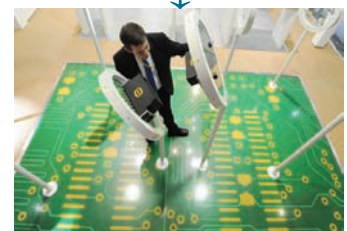
Ref. Nº 1105500