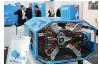
Industrial Supply ↓