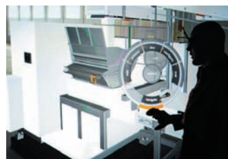
Digital Factory ↑