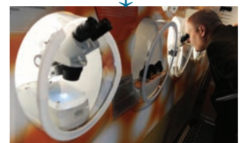
Research & Tech. ↓