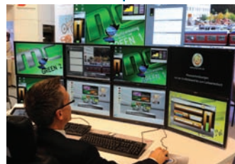
Power Plant Tech. ↑