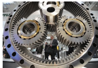
Motion, Drive & ↑ Automation