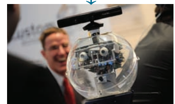
IndustrialGreen Tec ↓ (starting 2012)